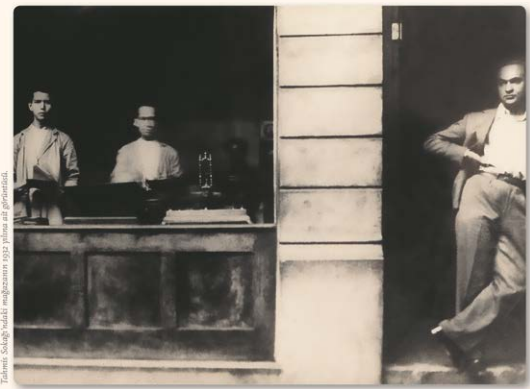
1871'den beri kalitesini ve tizliğini hiç bozmadan evlerimiz nefis Türk kahvesini getiren KURUKAHVECİ MEHMET EFENDİ , bugün 50'den fazla ülkede tüketiliyor. Kurukahveci Mehmet Efendi, Türklerin dünyaya armağan ettiği Türk kahvesini, her yudumda aynı kalite ve keyifle dünyaya ulaştırıyor.